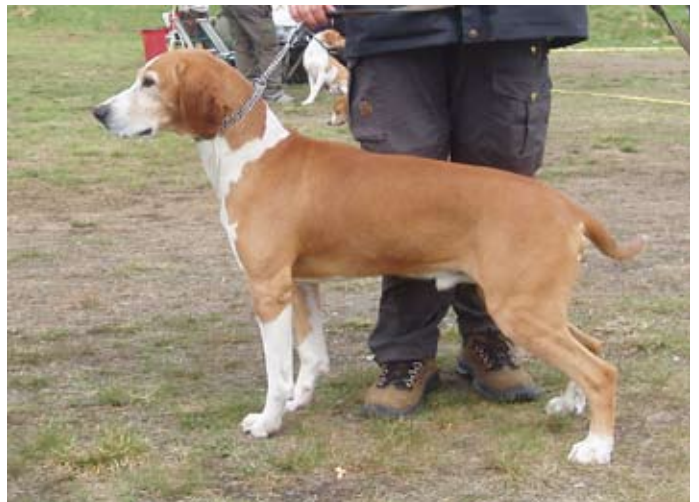
Hannhund av utmerket kvalitet. Det som er å bemerke er dunkerpreget på hode