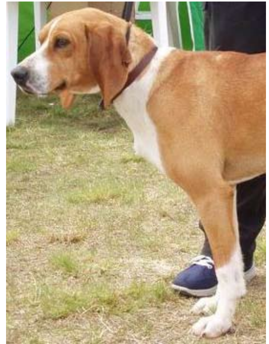
Her en hund med velutviklet frambryst og god vinkel i skulder og frambryst.

Kommentar: Fra noen av innkrysningene med finsk støver har det forekommet hunder med noe svak mellomhånd. Tidligere var et av ankepunktene på hygenhund at labbene var for dårlige. Noe løse poter og dårlig hårlag var problemet. Med innkrysningene har dette også bedret seg.