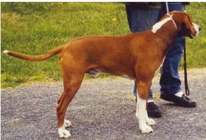
Et eldre bilde 20 år tilbake av en hannhund uten innkrysning, som var kjent for sin sterke, gode kropp.