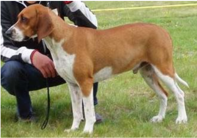
En hannhund av utmerket type av i dag der kroppen fremhever seg spesielt.