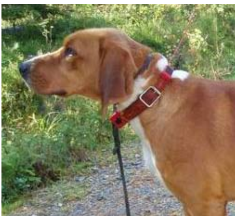
En hund med noe kraftig og kort hals. (Hunden har dessverre både halsbånd og peilerhalsbånd på som forstyrrer noe)