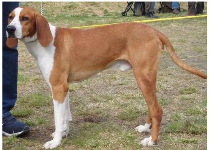
Her en hannhund med dårlige vinkler både foran og spesielt bak. Med smale muskelfattige lår.