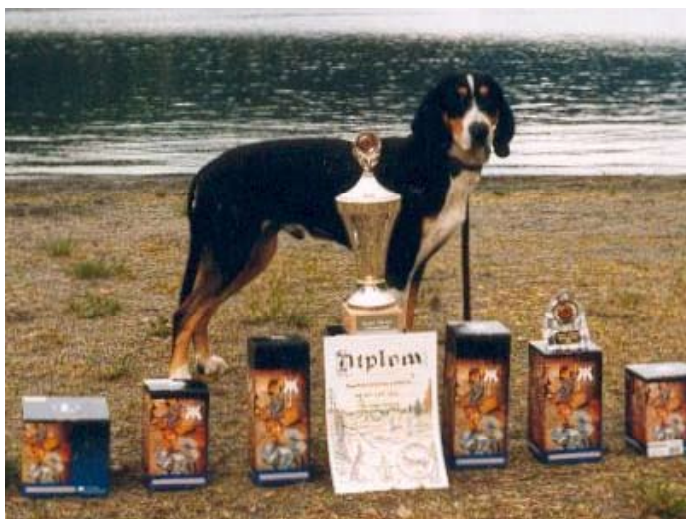
Sort og brun, som regel med hvite tegninger.