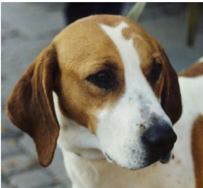
Et hygenhundhode av meget bra kvalitet. Fyller noe i kinnene. Aning lange ører.