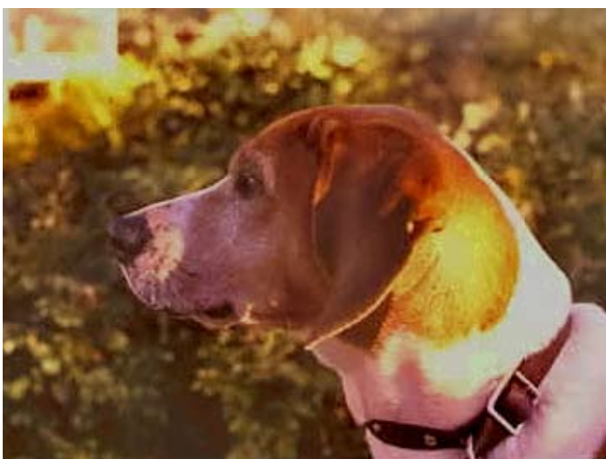
Et hygenhundhode fra over 30 år tilbake uten innkrysning.