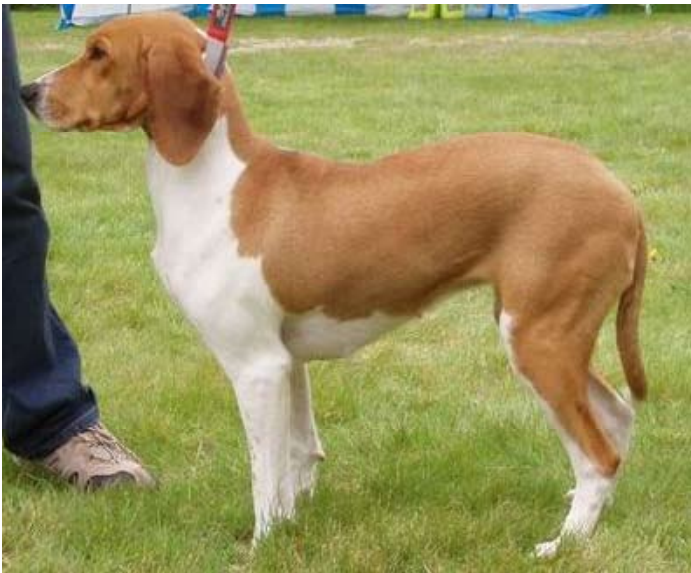
Ei tisper som både skyter lend og er sterkt oppknepet i buklinjen. Hun har også et sterkt avskytende kryss.