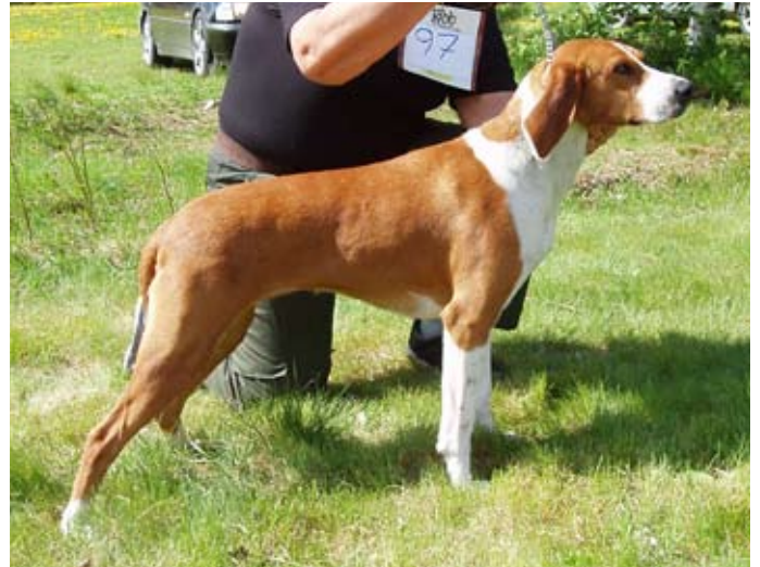
Tispe av meget god kvalitet, ønskelig med noe bedre bakkensvinkler. En hund som normalt vil oppnå CK.