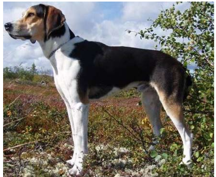
Her en hund med for steil skulder og manglende frambryst