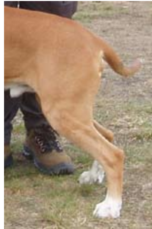
Her en hannhund med sterke gode lår og meget gode vinkler