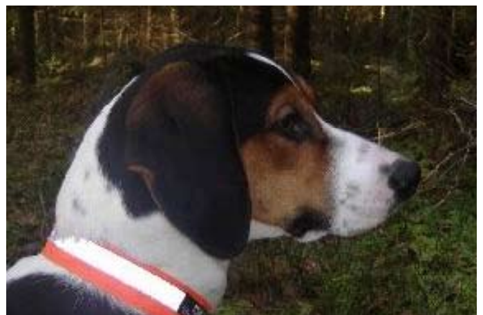
Et hode med de fleste kvalitetene fra standard. Dog en aning leppefold.