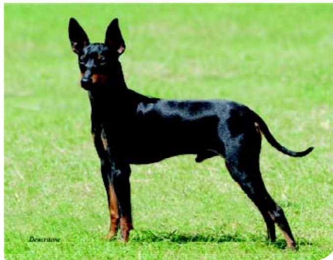
♦ Een moderne Engelse Toy Terrier uit de Britse kennel 'Amalek'. Dit ras is uitsluitend black-and-tan.

zijn de Engelse rassen – niet alleen honden maar ook paarden – favoriet. Russische aristocratische dames vertonen zich op party's en in de theaters met kleine Engelse Toy Terriers op hun arm of in de mouw van hun jas. Op een hondenshow in St. Petersburg, in 1907, zijn al elf Toy Terriers aanwezig.