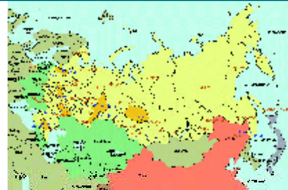
♦ Kaart van het moderne Rusland.

♦ In 1805 publiceert Sydenham Edwards in zijn 'Cynographia Britannica' deze afbeelding van de dan in Engeland voorkomende terriers. Links bovenaan een voorloper van de Manchester Terrier en Engelse Toy Terrier en daarmee ook van de van Russkiy Toy Terrier. (Let even op de terrier rechts boven met de blikkerende tanden!)