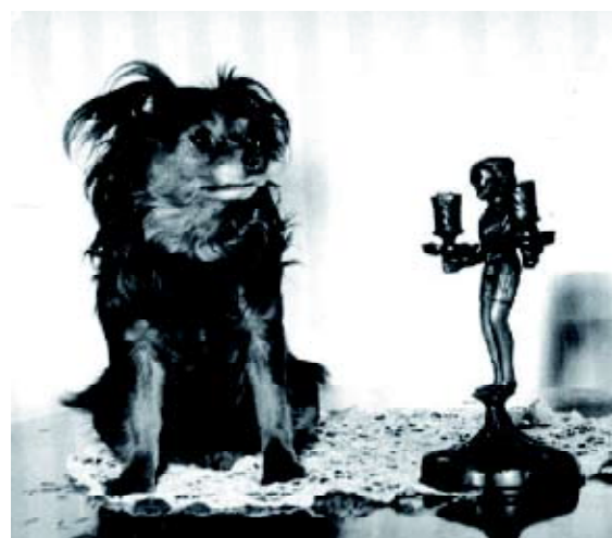
• Dit is de reu 'Chiki', geboren op 12 oktober 1958 die bij het opgroeien 'spectaculaire vlaggen' aan de oren, de hals en aan de benen krijgt. Hij is black-and-tan en is de stamvader van alle langharige Russkiy Toys.